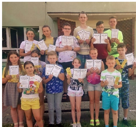
Foto: Uczestnicy i laureaci Ogólnopolskich Konkursów „Orzeł Matematyczny” i „Orzeł Informatyczny”

W związku z przeprowadzeniem przez panią Beatę Stadnik powyższych konkursów szkoła otrzymała Certyfikat Placówki Rozwijającej Talenty w roku szkolnym 2020/2021.