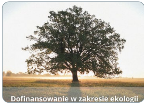
Dofinansowanie w zakresie ekologii

Gmina Prószków stawia na ekologię i pokazuje, że dbanie o środowisko naturalne jest jednym z jej priorytetów. Uruchomienie serii programów dofinansowania na proekologiczne inicjatywy jest potwierdzeniem zaangażowania w promowanie zrównoważonego rozwoju i poprawy jakości życia swoich mieszkańców. Od usuwania azbestu, przez zbieranie odpadów rolniczych, aż po wspieranie wymiany pieców węglowych na ekologiczne rozwiązania.