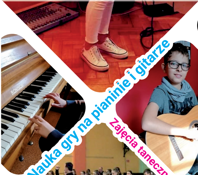
Nauka gry na pianinie i gitarze