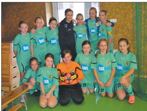
Polonia Prószków - drużyna dziewcząt

II Turniej Mikołajkowy zorganizowany przez Soccer College Łubniana 9 grudnia 2012 r. goszczący 7 drużyn, rozgrywano systemem „każdy z każdym”. Drużyny, mimo przyjacielskiego nastawienia i hołdowania idei fair play, grały twardo i nie odpuszczały.