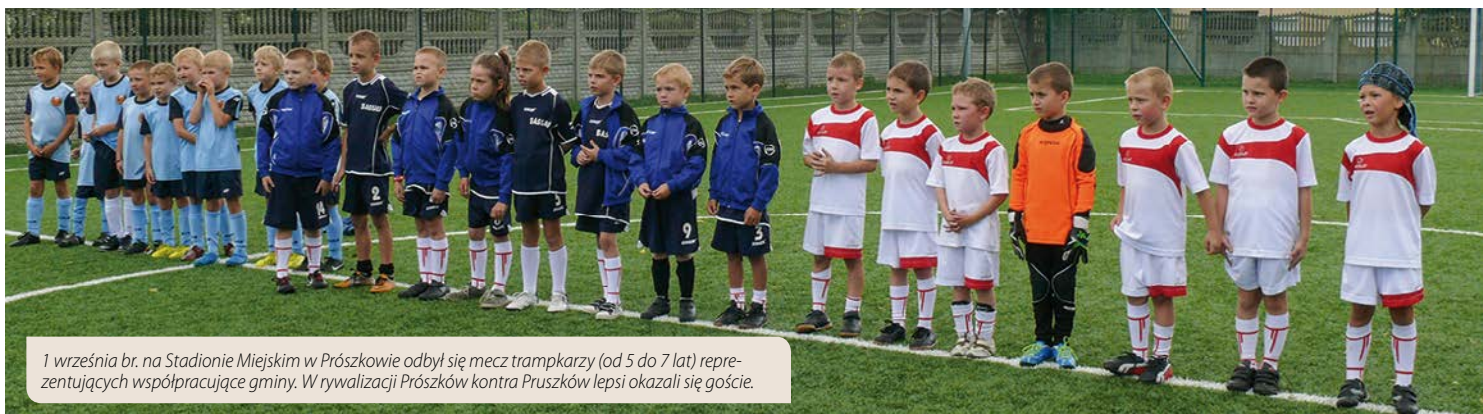
1 września br. na Stadionie Miejskim w Prószkowie odbył się mecz trampkarzy (od 5 do 7 lat) reprezentujących współpracujące gminy. W rywalizacji Prószków kontra Pruszków lepsi okazali się goście.