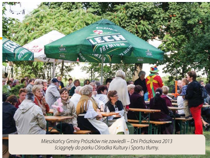
Mieszkańcy Gminy Prószków nie zawiedli – Dni Prószkowa 2013 ściągnęli do parku Ośrodka Kultury i Sportu tłumy.