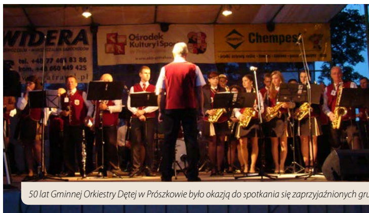
50 lat Gminnej Orkiestry Dętej w Prószkowie było okazją do spotkania się zaprzyjaźnionych grup muzyków. Na zdjęciach: sygnaliści zespołu „Leśny Róg” oraz Gminna Orkiestra Dęta w Prószkowie.