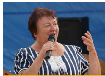
Róża Malik - Burmistrz Prószkowa