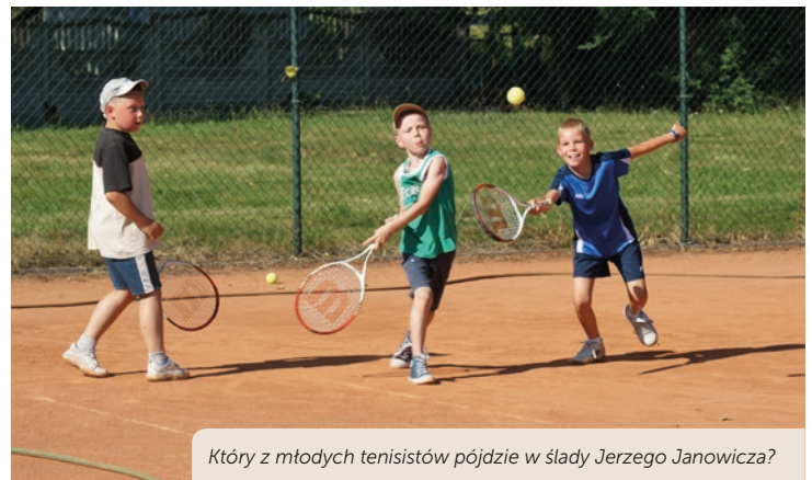
Który z młodych tenisistów pójdzie w ślady Jerzego Janowicza?

Zwracamy się z uprzejmą prośbą o wsparcie założonego przez Fundację Klubu Tenisowego wpisanego na listę Polskiego Związku, numer licencji: LK/111/2013/OP.