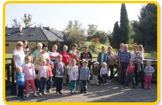
Uczestników wycieczki zachwyliła przestrzeń ogrodu; zostali też zaproszeni przez organizatorów na słodki poczęstunek.