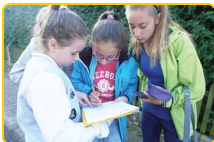
Przyjaźń między nauką i zabawą znana jest od dawna. Uczniowie i uczennice z Prószkowa bawili się w podchody

a nawet wstępnie określić, jaka profesja będzie dla nich najlepsza. Projekt trwa od września do czerwca i realizowany jest w ramach Działania 9.1.2 (Wyrównywanie szans edukacyjnych). Oprócz wyżej wymienionych zajęć dodatkowych, projekt obejmuje też nabycie przez szkołę pomocy dydaktycznych (np. modułów do robotyki, mini stacji meteorologicznej) oraz wyjazdy w ciekawe i stymulujące intelektualnie miejsca - do Centrum Nauki Kopernik w Warszawie oraz - bliżej - do Centrum Nauk Przyrodniczych w Opolu. Jeśli chodzi o same zajęcia dodatkowe - uczeń może zapisać się na jedno lub więcej. Uczestnictwo w tego rodzaju przedmiotach wiąże się z późniejszym wyjściem ze szkoły, w okolicach godziny szesnastej.