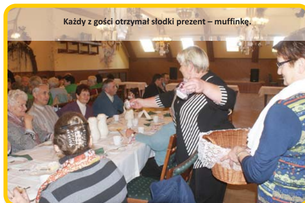
Każdy z gości otrzymał słodki prezent – muffinkę.