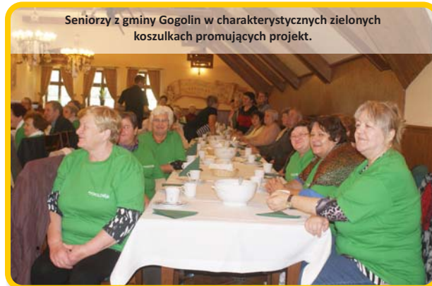
Seniorzy z gminy Gogolin w charakterystycznych zielonych koszulkach promujących projekt.