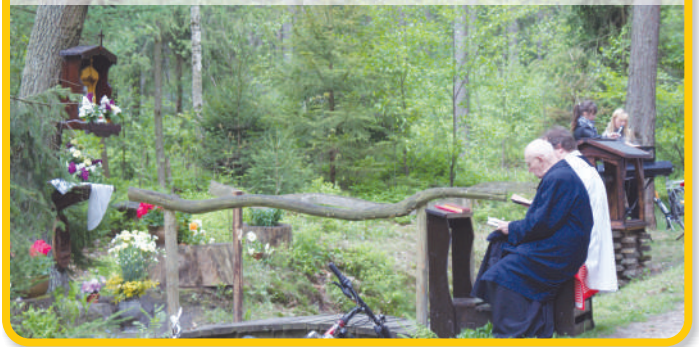
Zespół z DFK razem ze swoimi kapłanami.