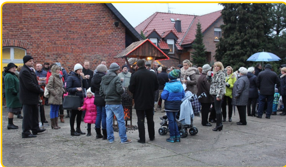
Chrząszczyce tłumnie odwiedziły świąteczny kiermasz.

okazją nie tylko na zakupienie podarunków, ale też na spotkanie ze znajomymi i wspólne pożyczenie sobie: Wesołych Świąt!