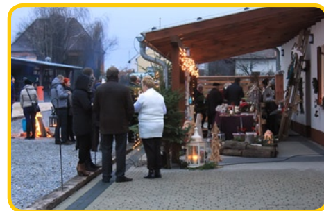
Żlinice zaskoczyły pomysłowością i oryginalnymi świątecznymi ozdobami

Bożonarodzeniowy Kiermasz mógł nie tylko poczuć magię zbliżających się świąt, ale też miał niepowtarzalną okazję zaopatrzyć się w oryginalne podarunki dla najbliższych. Choć zabrakło bajkowej scenerii, a z nieba zamiast białego puchu spadło kilka kropel deszczu, frekwencja jak zwykle dopisała. Na świątecznych straganach znalazły się bombki, stroiki świąteczne, lukrowane piernczki i grzane wino. Kiermasz był doskonałą