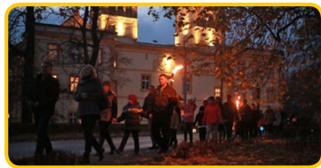
Mieszkańcy Prószkowa w blasku pochodni wspominali św. Marcina

11 listopada to oczywiście nasze święto narodowe ale jest to również dzień, którego patronem jest św. Marcin. Czy znacie jego historię? Był on rzymskim legionistą. Kiedy zimą napotkał półnagiego żebraka, oddał mu połowę swojego płaszcza. W nocy we śnie pojawił mu się Chrystus odziany w jego płaszcz i przemówił do aniołów: Patrzcie, jak mnie Marcin, katechumen przyodziął. Marcin porzucił wojsko, służył