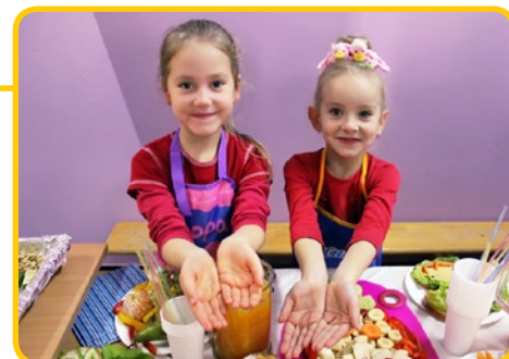
Uczennice dumnie prezentują wykonane przez siebie potrawy