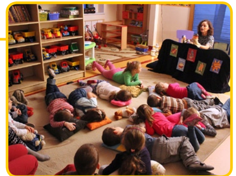
Dzieci czy rodzice? Kto pierwszy zasną? :)

bezpieczeństwo, poszerzające zwyczaje europejskie. Podczas spotkania pod hasłem „Bajki grajki” dzieci inscenizowały ruchem piosenki, grały na instrumentach zrobionych z wieszaków aktywnie słuchając muzyki Batti Strauss. Rodzice również aktywnie uczestniczyli w spotkaniu, poprzez zabawę z chustą animacyjną, zapowiadając inscenizację z wykorzystaniem pacynek do bajki „O rybaku i złotej rybce”, a wspólne płasy do piosenki „Kaczuszki” poprzedziły wysłuchanie bajki „Brzydkie kaczątko”. Na zakończenie