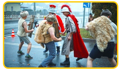
Ulica w Boguszycach w sobotę zamieniła się w pole walki...

W Chrzęszczycach podobnie jak w Prószkowie świętowanie rozpoczęło się w kościele lecz nie od pochodu, ale od nabożeństwa. Po chwili modlitwy, na placu kościelnym