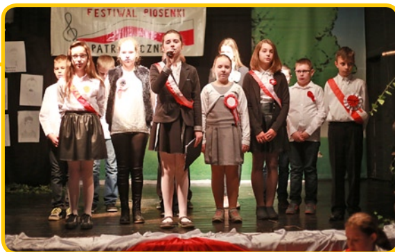
Uczniowie klasy 6 na dużej scenie Ośrodka Kultury i Sportu w Prószkowie

11 listopada 1918 roku po 123 latach pod zaborami Polska odzyskała niepodległość. 97 lat po tym niezwykle ważnym wydarzeniu w historii naszego kraju w całej Polsce odbyły się uroczystości upamiętniające. W Ośrodku Kultury i Sportu w Prószkowie już 10 listopada uczniowie z Publicznej Szkoły Podstawowej uczestniczyli w obchodach dnia niepodległości. Uroczystość rozpoczęła się od odśpiewania „Mazurka Dąbrowskiego”, a następnie rozpoczęła się część