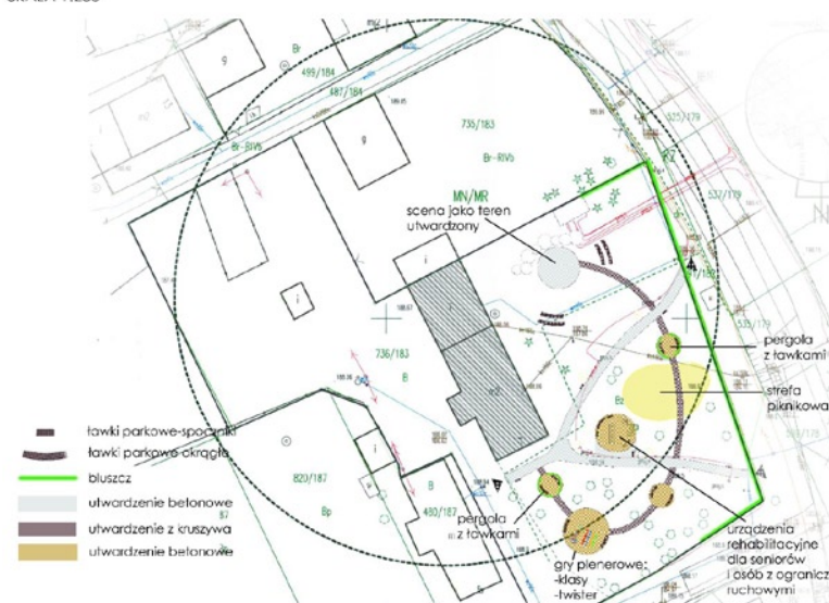
KONCEPCJA PARKU WIEJSKIEGO ZE STREFĄ REHABILITACYJNĄ DLA SENIORÓW W JAŚKOWICACH SKALA 1:250